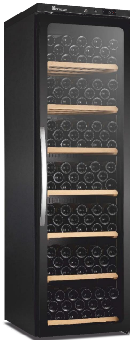
CV 450 PV