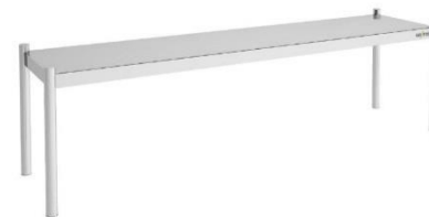
ESD 1 niveau