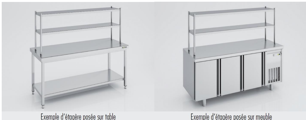
Exemple d'étagère posée sur table