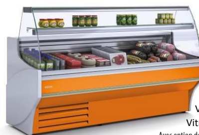
VE-8-20-C Vitre bombée Avec option décoration frontale couleur