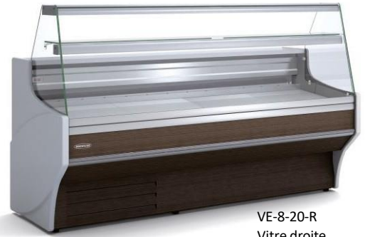
VE-8-20-R Vitre droite Avec option décoration frontale imitation bois