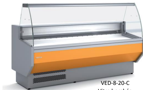
VED-8-20-C Vitre bombée