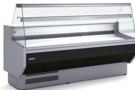
VED-8-20-R Vitre droite Avec étagères en option