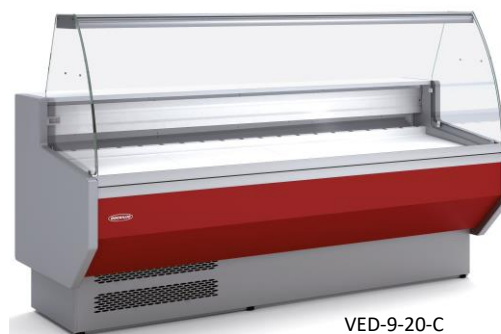
VED-9-20-C Vitre courbe