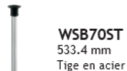
WSB70ST 533.4 mm Tige en acier