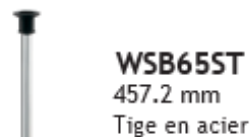
WSB65ST 457.2 mm Tige en acier