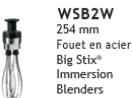
WSB2W 254 mm Fouet en acier Big Stix® Immersion Blenders