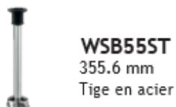
WSB55ST 355.6 mm Tige en acier