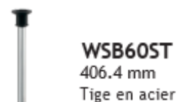
WSB60ST 406.4 mm Tige en acier