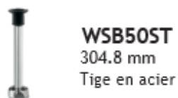
WSB50ST 304.8 mm Tige en acier