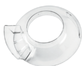
WSM7LSG Goulotte d'alimentation