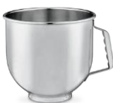
WSM7LBL Bol en acier