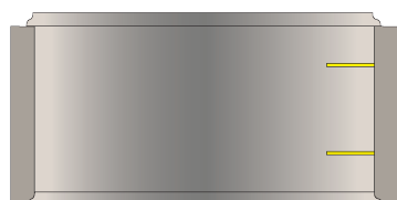
Element H 60 cm avec ou sans échelon