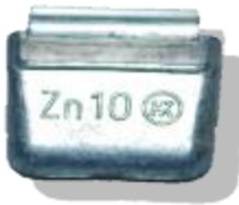
Masses en zinc non plastifiées à crochet intégré