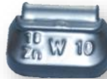
Masses en zinc plastifiées à crochet intégré