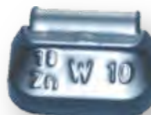
Masses en zinc plastifiées à crochet intégré