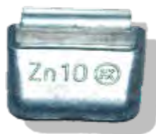
Masses en zinc non plastifiées à crochet intégré