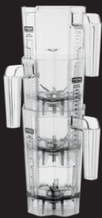
1,4 L Empilable Récipient en copolyestersans BPA