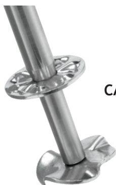
CAC112 Agitateur solide (6 packs)