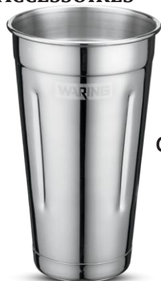
CAC20 Gobelet en acier inoxydable