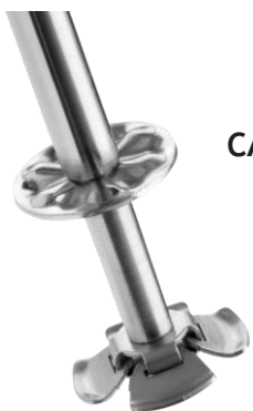
CAC123 Agitateur papillon (6 packs)