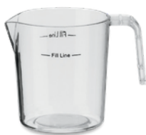
DOSEUR À PÂTE