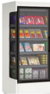
Côté ABS (de série)