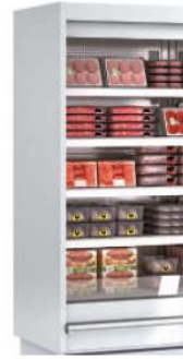
Côté plein (LC) (même prix)