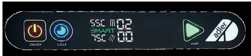
Panneau de commande