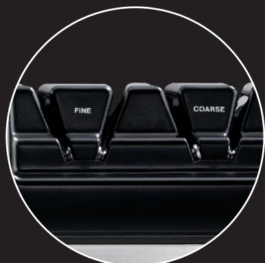
Meules fines et grandes